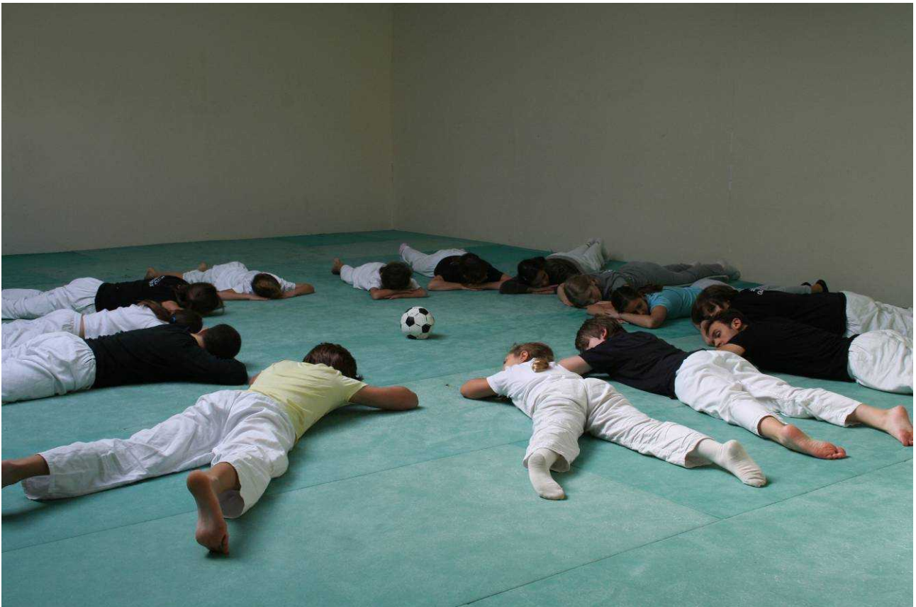
Beim Filmdreh im September: Entspannung gehört zum Training