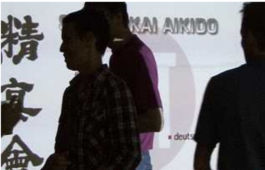
Stimmungsvoll: Die DVD-Release-Feier am 22. Juli im Hombu Dojo