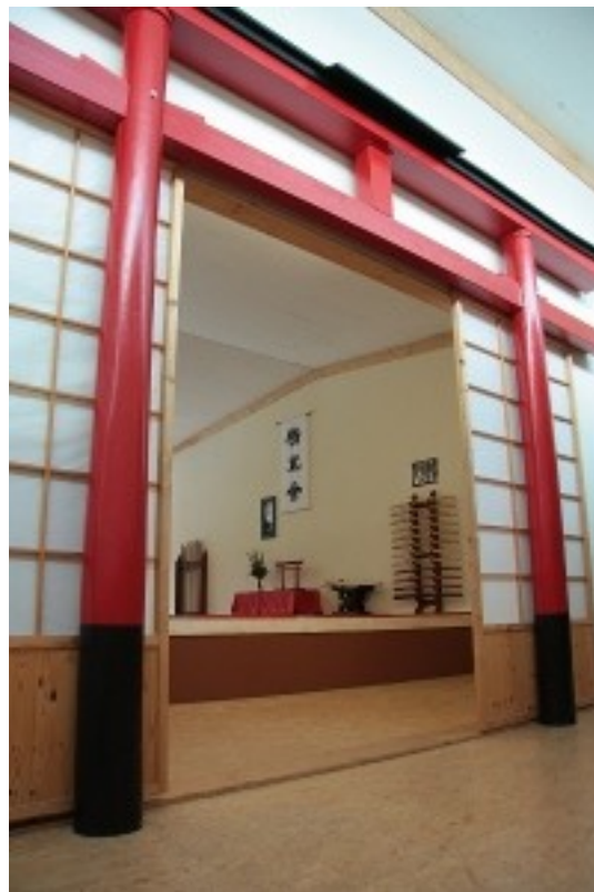
Das Tori, Symbol von Seishinkai Aikido e. V., am Eingang