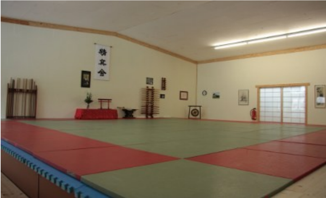
Die neuen Räume des AZ Ulm / Neu-Ulm

Ein Meilenstein für das AZ Ulm / Neu-Ulm ist in 2012 der Umzug in die neuen Räume, die wirklich sehr schön geworden sind.