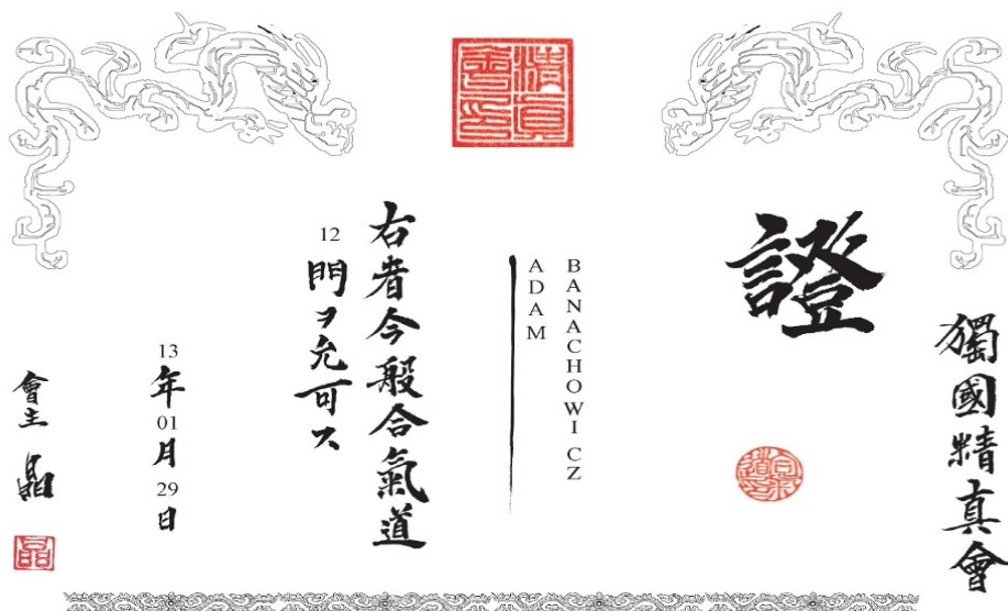
Die neuen Kyu- und Mon-Urkunden von Seishinkai Aikido Deutschland e. V.